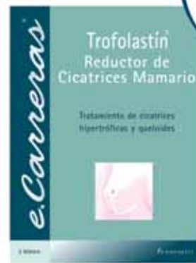
3 blisters de 2 apósitos